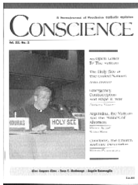
Le magazine de Catholics for a free choice

l'on appelle une organisation non gouvernementale... Et non pas un Etat. Dès 1957, le Vatican est parvenu à ce que les Nations Unies réfèrent de leurs décisions au Saint-Siège. En 1964, Paul VI envoie le premier représentant du Saint-Siège à l'ONU. Sans qu'aucune décision, ni loi ni décret, n'ait été prise, le voilà devenu observateur permanent bien qu'Etat non membre. Ce statut transitoire et exceptionnel lui permet de participer à tous les débats de l'organisation sans avoir pour autant à se conformer aux programmes de l'ONU. Y compris ceux sur l'alphabétisation et le contrôle des naissances contre lesquels le Vatican mène bataille, à l'intérieur de son territoire en tant qu'Etat et ailleurs dans le monde sous forme de groupe d'intérêt ! Pire, s'il n'est pas soumis aux devoirs et contraintes imposées aux Etats membres, cet observateur permanent non membre semble bel et bien bénéficier de l'ultime avantage réservé aux pays membres : à savoir le droit de vote. En résumé, le Saint-Siège apparaît de deux façons : à la fois comme groupe de pression et comme