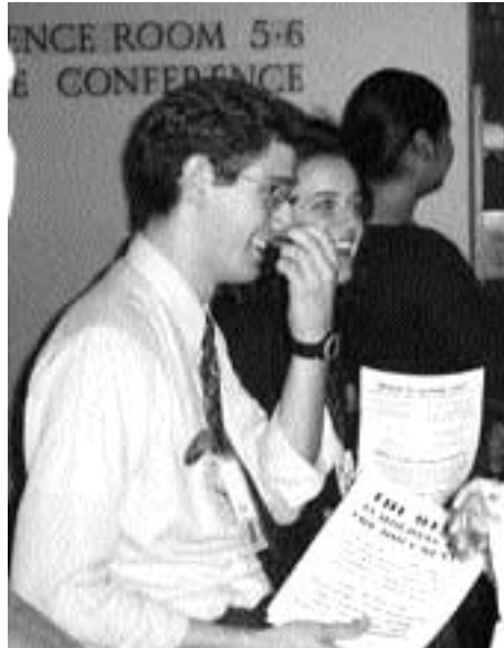
Les pro-life en train de distribuer un tract anti-choix à l'ONU ont eu à le faire sous l'oeil attentif de ProChoix

Côté français, tandis que la plupart des ONG suivaient attentivement les débats pour en rendre compte au sein du Lobby européen des femmes, Les Pénélopes avaient pris leurs