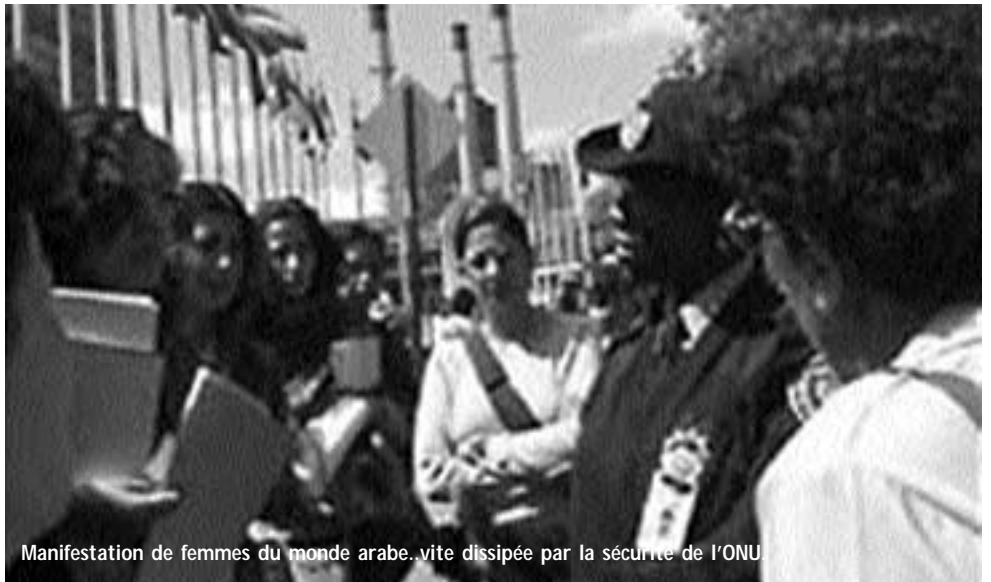
Manifestation de femmes du monde arabe, vite dissipée par la sécurité de l'ONU

Comme nous l'avons souvent dénoncé dans ProChoix (voir le dossier du n° 14), la maison du pape jouit d'un statut d'observateur permanent à l'ONU, très utile pour mener un travail de coulisses auprès du Groupe des 77, qu'il persuade habilement de s'opposer aux droits à l'avortement et aux droits des homosexuels en les présentant comme les deux faces d'un complot impérialiste mené par l'Ouest. Ce qui semble prendre à merveille. Finalement, la seule chose qui manque au Vatican, c'est le droit de vote. Ça tombe bien, puisqu'aux Nations Unies les décisions ne sont presque jamais mises au vote mais au consensus ! Autrement dit, c'est le temps de parole qui compte. Et en l'occurrence, dans la mesure où le JUSCANZ et l'Union européenne sont d'accords au point de parler à l'unisson, mais qu'à l'inverse le groupe des 77 s'est émietté au fil des négociations, ce sont essentiellement les envoyés du Vatican et les représentants des pays les plus conservateurs qui ont tenu le crachoir. A savoir essentiellement le "saint-siège", l'Algérie, le Soudan, la Libye,