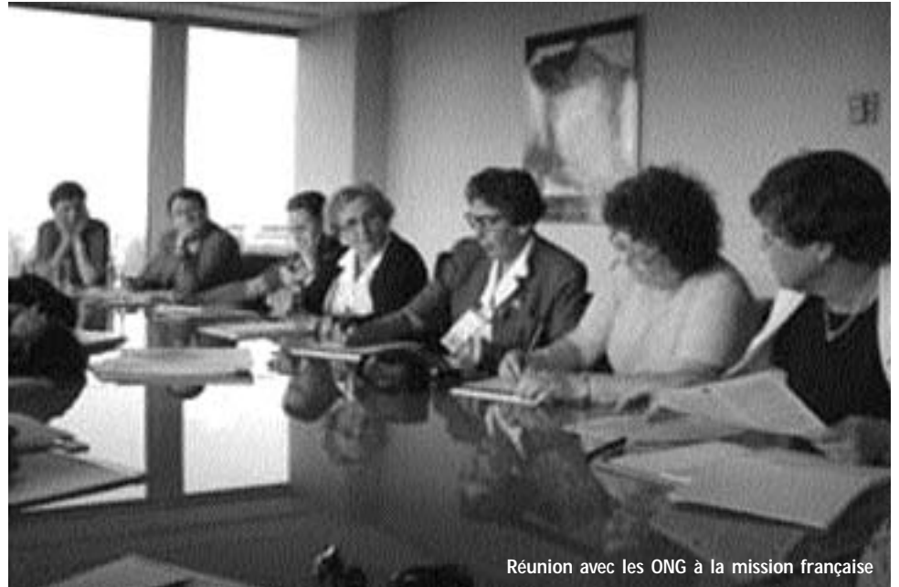
Réunion avec les ONG à la mission française

La première des constatations, c'est que les femmes continuent de représenter l'immense