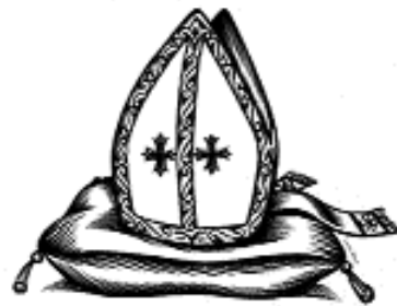
affiche de Catholics for a free choice

Worn correctly, it can prevent unintended pregnancy, AIDS, and abortion.