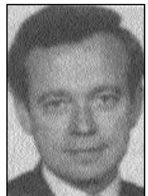
Renaud Donnedieu de Vabres